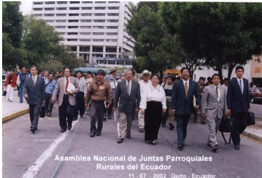
Foto: I Marcha de Juntas Parroquiales Rurales